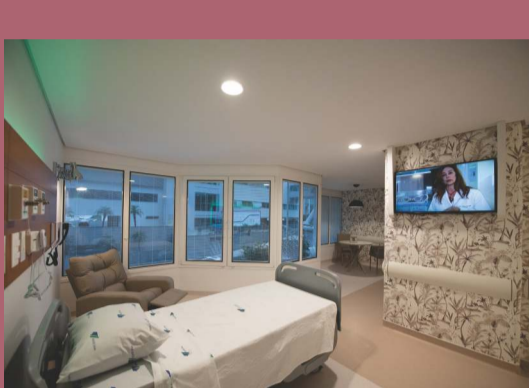
SUITES (Consultar upgrade)

Conta com um suporte de plantação de Obstetrícia 24 horas para atendimento das mães em trabalho de parto, além de atender prontamente as gestantes e puérperas internadas, caso necessitem.