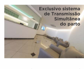
Exclusivo sistema de Transmissão Simultânea do parto