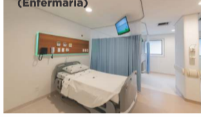
Boxes com TV (Enfermaria)

Oferece apartamentos modernos e confortáveis, com sistema de alojamento conjunto, que permitem a permanência do bebê com a mãe em tempo integral.