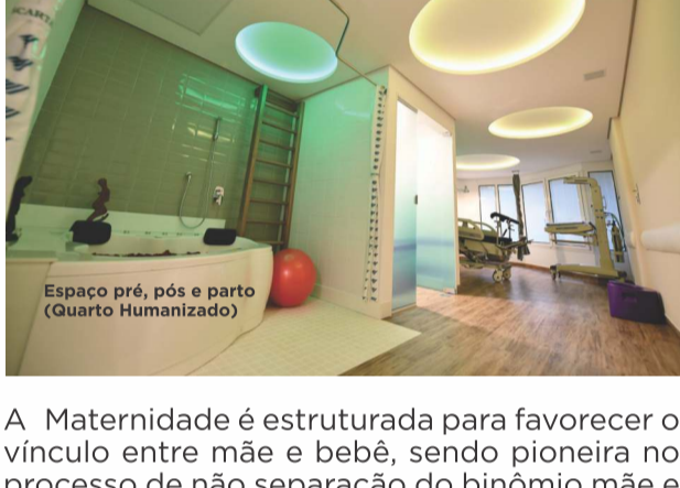
Espaço pré, pós e parto (Quarto Humanizado)

A Maternidade é estruturada para favorecer o vínculo entre mãe e bebê, sendo pioneira no processo de não separação do binômio mãe e filho. Seu bebê fica com você e seu cônjuge desde o nascimento até o retorno do Centro Cirúrgico, ou sala de parto, para o quarto.