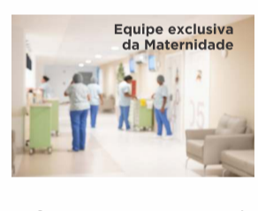
Equipe exclusiva da Maternidade

Para a harmonia e bom funcionamento do nosso serviço, algumas rotinas devem ser observadas: